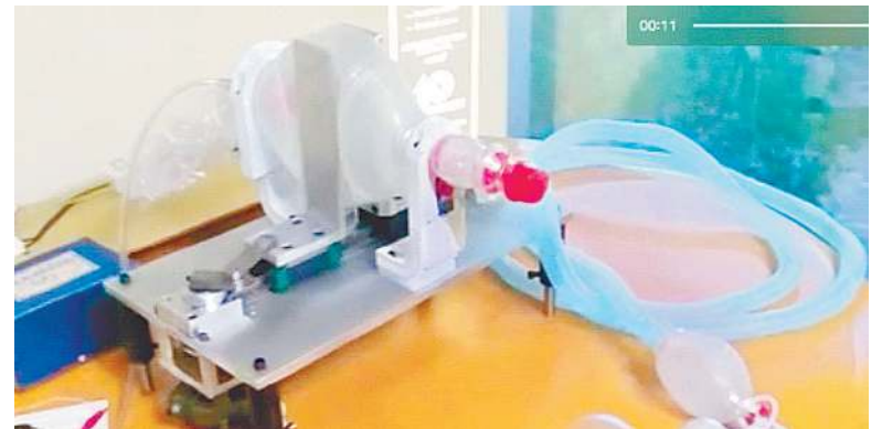
CIO, investiga científicamente la pandemia y da soluciones.

“Algunas gotículas pueden alcanzar velocidades de 90 u 80