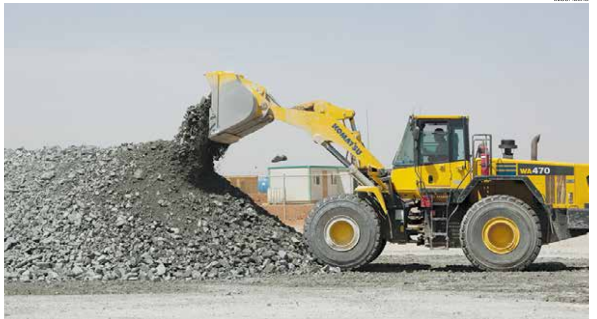
INVERSIÓN. Para emprender un negocio en el ramo de la construcción se requieren 500 mil pesos.

versidades del Valle de México, Cuauhtémoc, Anáhuac, Univa, Autónoma de Querétaro, el Instituto Tecnológico de Querétaro y el Tecnológico de Monterrey, en donde, entre todas, están estudiando cerca de tres mil jóvenes una carrera relacionada con el giro de la construcción (arquitectura o ingeniería civil).