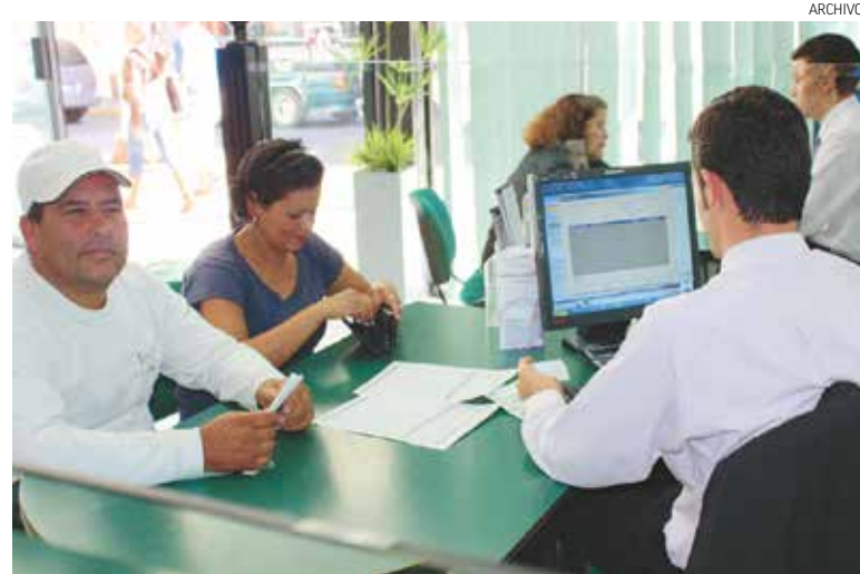
CAJA POPULAR MEXICANA. Otorgó en todo el país durante 2013 créditos con fines vacacionales por 143 millones 76 mil 292 pesos.

ciento de los socios de Caja Popular Mexicana han tenido acercamiento a estos productos.