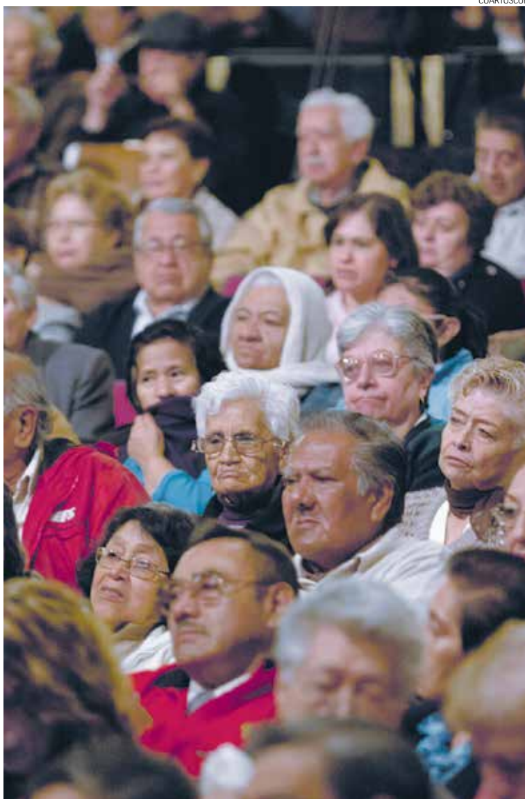
PENSIONADOS. Expertos recomiendan cambiar los beneficios, reducir la pensión que está garantizada e incrementar las aportaciones.

Reservas limitadas. De no darse cambios, para el año 2041 las reservas no serán suficientes para pagar las pensiones y el gobierno estatal tendrá que pagar la diferencia