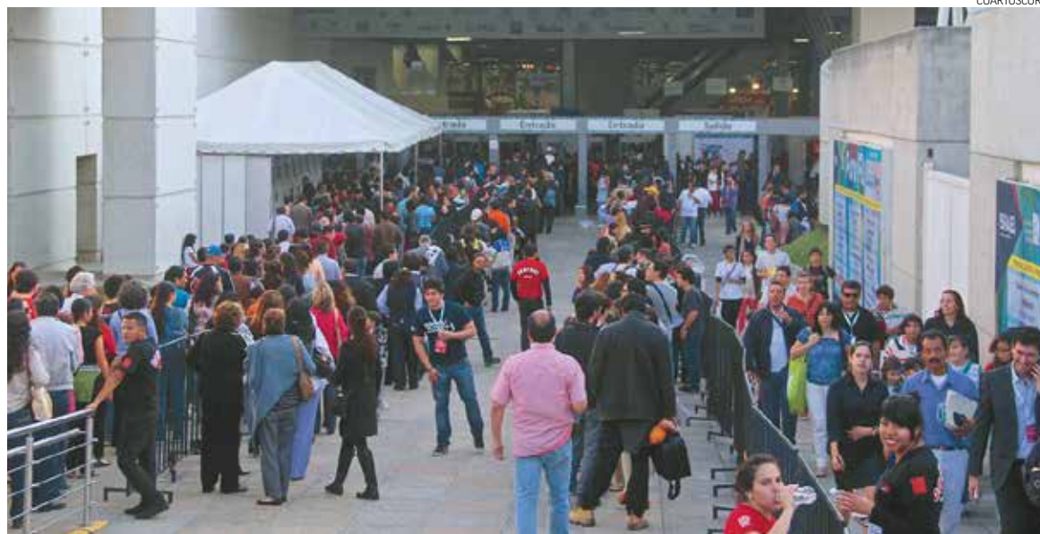
TURISMO DE REUNIONES. El mayor mercado turístico de la entidad.