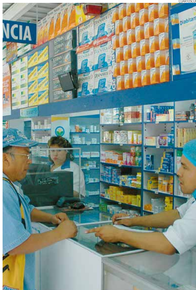
INVERSIONES. El instituto cuenta con una cadena de farmacias, con presencia en todos los municipios del estado y algunos de Jalisco y Michoacán.