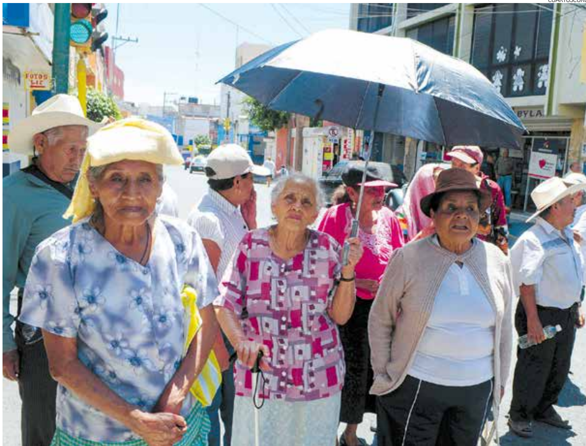
PENSIONES. El sistema de pensiones de Guanajuato necesita obtener rendimiento anual de 5.5 por ciento para tener solvencia.

Estas estrategias no son únicas del ISSEG, pero tampoco están generalizadas en los sistemas pensionarios del país. Considero que el ISSEG es de los sistemas que tienen más diversificados sus ingresos, porque generalmente los institutos de pensiones sólo captan contribuciones y subsidios, entonces el ISSEG está mejor en ese sentido, mejor balanceado.