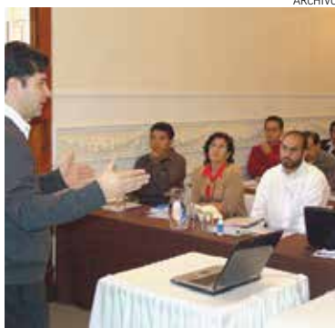
CAPACITACIÓN. En lo que va del año se han capacitado a 476 personas.